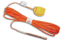
E*STAR Iniciación electrónica