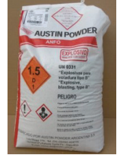
Austinite ANFO en bolsas