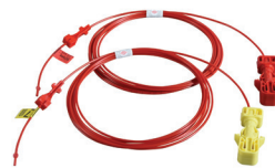
Shock*Star Surface Connector Detonadores no eléctricos