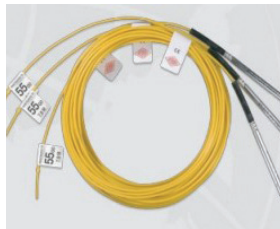
Shock*Star TS Detonadores no eléctricos (500 - 9600 ms)