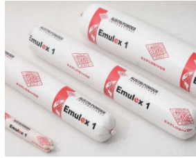
Emulex 1 Emulsión sensible a detonador