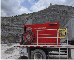
Hydromite 100 Emulsión a granel