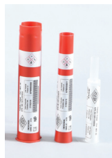
APB Mini Booster (20, 40 & 100 gramos)