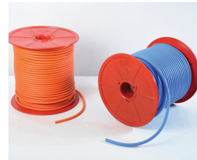
APA Cord Cordón detonante con núcleo de pentrita