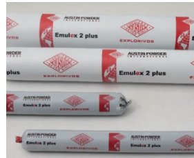
Emulex 2 Plus Emulsión sensible a detonador