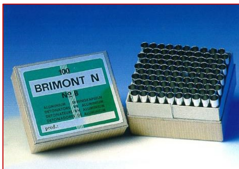
Art. Nr. 703.108 Brimont Sprengkapsel Nr. 8

Durchmesser außen: ca. 5 mm Brenndauer: 120 ± 10 sec/m Rollenlänge: 250 m oder 100 m