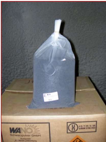
Art. Nr. 701.047 Sprengpulver 2 / 1,0 – 8,0 mm

Hier finden Sie eine Übersicht über unser aktuelles Schwarzpulver, sowie über die Sicherheitsanzündschnur, die Sprengkapsel und die Sicherheitsanwürgezange. Wenn Sie nähere Informationen zu den einzelnen Produkten benötigen, können Sie uns gerne kontaktieren.